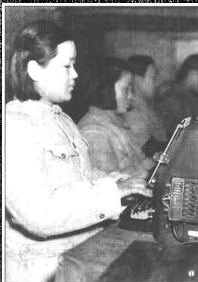
志愿军女报务员在紧张工作。 志愿军女卫生员在战地救护伤员。 志愿军后勤部队的女战士在为前线的将士赶制棉裤。 志愿军女文工团员冒着生命危险深入前沿阵地，在防空洞里为战士们演出。

据新华社北京10月19日电 (记者 曲志红)据第五届茅盾文学奖评奖办公室公告，第五届茅盾文学奖评奖已于10月12日圆满结束。张平的《抉择》、阿来的《尘埃落定》、王安忆的《长恨歌》和王旭烽的《茶人三部曲》(1、2)四部作品在本届评选中最后赢得桂冠。据评奖办公室介绍，本届茅盾文学奖评选的范围是1995年至1998年底出版的长篇小说，共有138部作品被推荐参加了这次评选。本版编辑 牟玉娟